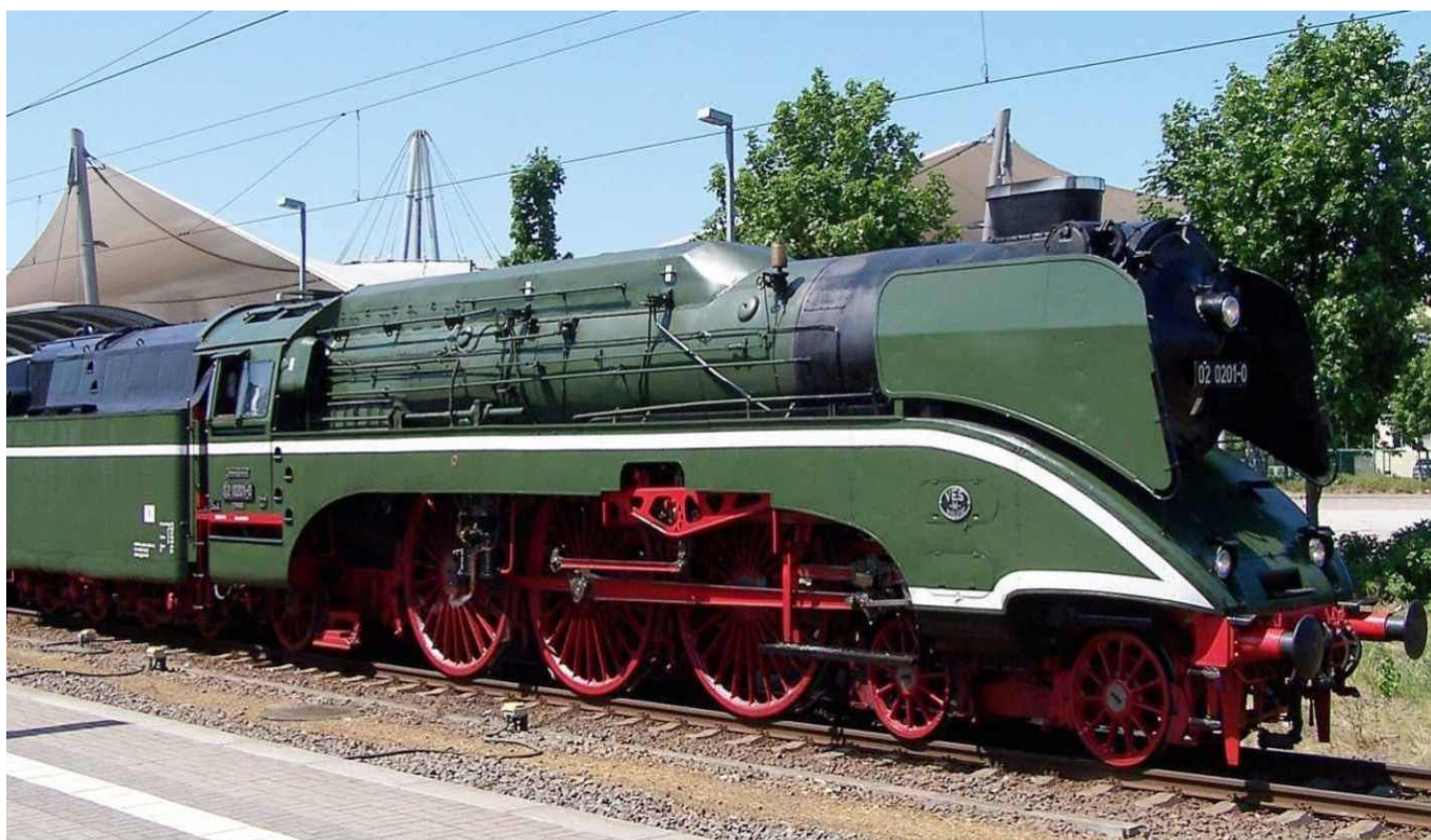
Parowóz BR 18 201 w Lutherstadt Wittenberg.

Redakcja Konsultacja merytoryczna: Marek Kołodziejcki