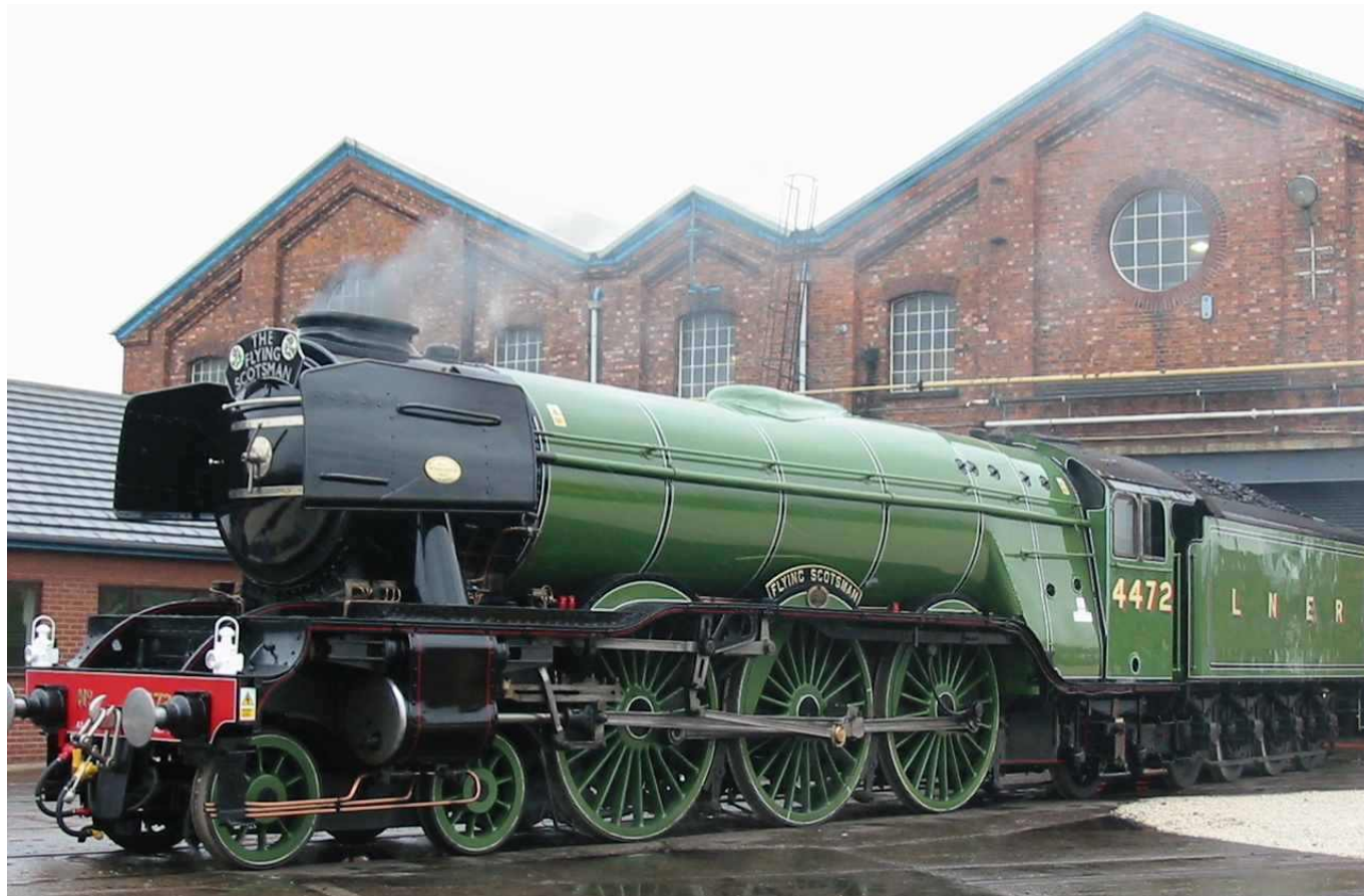
Latający Szkot w Doncaster w 2003 roku.

Czy wiecie, jaką prędkość mógł osiągnąć najszybszy parowóz i skąd pochodził? Zapraszamy do naszego artykułu, w którym odpowiemy na te pytania!