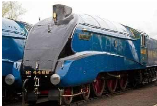
Photo by Tony Hisgett from Birmingham, UK - Mallard Uploaded by Ultra7, CC BY 2.0, https://commons.wikimedia.org/w/index.php?curid=20885602

Taką maksymalną prędkość rozwija niemiecki parowóz, należący do Towarzystwa LDC eV Cottbus BR 18 201. Parowóz został zbudowany w 1939 r, jednak w 1961 r. został przebudowany na klasyczny parowóz pospieszny. Bywa częstym gościem na odbywającej się co rok Paradzie Parowozów w Wolsztynie. Niestety na polskich torach nie jest w stanie zaprezentować w pełni swoich możliwości. Lokomotywa z początku służyła tylko do testowania wagonów pasażerskich, jednak ze względu na zbyt duże koszty nigdy nie weszła do seryjnej produkcji. Maksymalna prędkość, jaką mogła osiągnąć ta maszyna to aż 180 km/h. BR 18 201 może pochwalić się nie tylko uzyskiwaną prędkością wśród