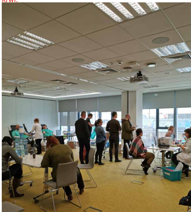
Zbiórka krwi w siedzibie PKP S.A.

W styczniu odbyła się pierwsza cykliczna zbiórka, której organizatorem były PKP Polskie Linie Kolejowe S.A. w Poznaniu, gdzie krew oddało 27 osób co dało 12 litrów krwi.