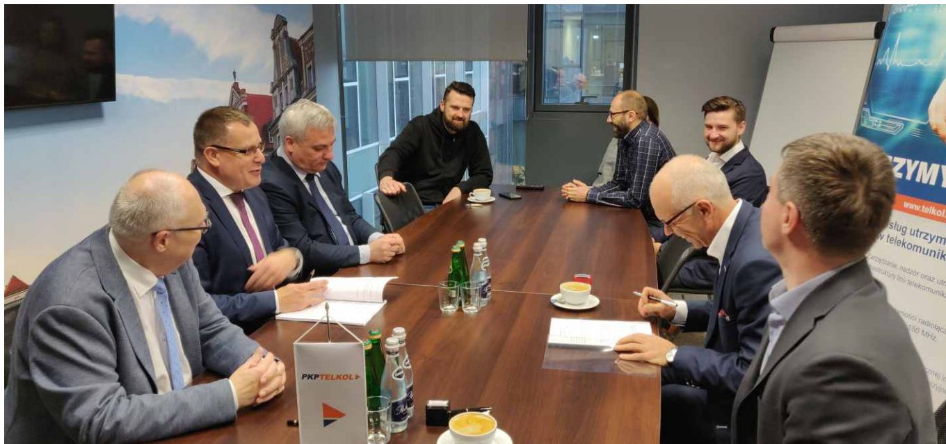
Zarządy PKP TELKOL i TK Telekom podczas podpisywania umowy w siedzibie PKP TELKOL.