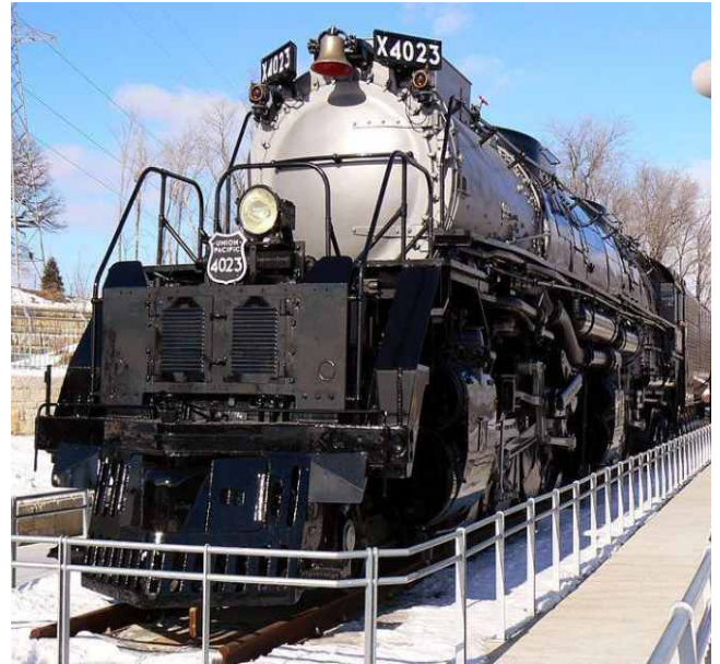
Big Boy #4023 na wystawie w mieście Omaha, Nebraska.

W pierwszej połowie lat 40. wyprodukowano 25 maszyn i każda z nich miała po 12 osi z czego 8 stanowiły osie napędne. Mogły one uciągnąć skład wagonów towarowych o masie 3300 ton. W opinii wielu ekspertów konstruktorzy Big Boya osiągnęli maksimum możliwości trakcji parowej, biorąc pod uwagę ograniczenia powodowane skrajnią dla linii normalno-orowych.