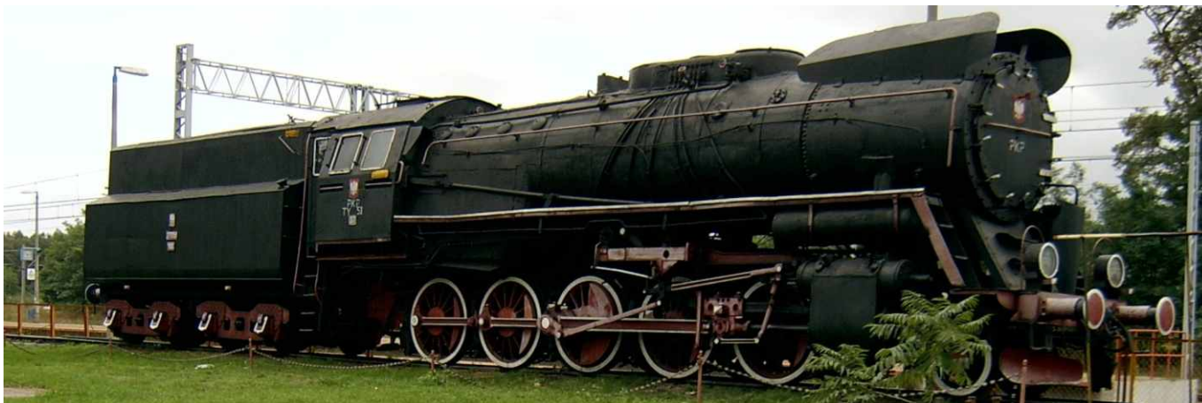
Lokomotywa parowa Baureihe Ty51 na stacji w Rzepinie - pomnik.

Konsultacja merytoryczna: Marek Kołodziejski.