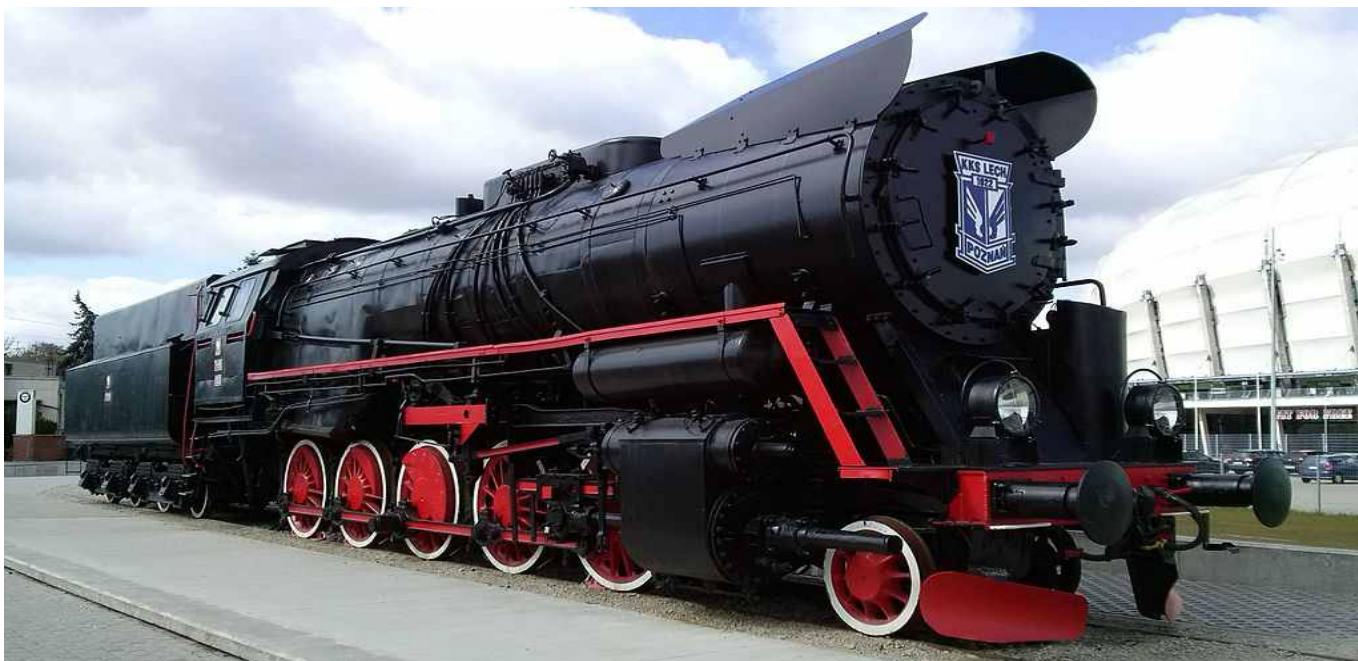
Parowóz Ty51 przy stadionie miejskim przy ulicy Bułgarskiej w Poznaniu. Fot. Koeftac CC BY-SA 4.0

https://commons.wikimedia.org/wiki/File:Parow%C3%B3z_Ty51_przy_stadionie_INEA_w_Poznaniu-1.jpg#/media/Plik:Parow%C3%B3z_Ty51_przy_stadionie_INEA_w_Poznaniu-1.jpg