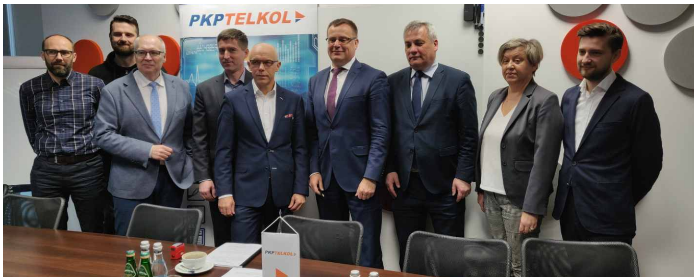
Zarządy Spółek wraz z zespołem negocjacyjnym.