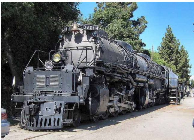
Union Pacific 4-8-8-4 "Big Boy" #4014, Pomona, California, USA.

Największe w historii parowozy pochodzą z USA. Seria imponujących maszyn nosi nazwę Big Boy. Były to najdłuższe parowozy na świecie i zarazem jedne z ostatnich w historii pojazdów napędzanych parą i opalanych węglem. Ich masa służbowa, czyli z maksymalnym zapasem paliwa i wody wynosiła ok. 550 t. Maszyny do dziś swoim ogromem i osiągnięciami budzą podziw. Długość lokomotywy wraz z tendrem to ponad 40 m i z tego powodu, żeby móc właściwie wpisywać się w łuki, parowóz był wykonany jako dwuczłonowy w systemie Malleta (przedni zespół napędny był ruchomy/skrętny jak wózki we współczesnym taborze kolejowym, drugi zespół był zamocowany na sztywno). Mimo, że była to lokomotywa przeznaczona do obsługi ciężkich pociągów towarowych, osiągała bardzo dużą prędkość maksymalną, wynoszącą około 130 km/h. Lokomotywa ta wsparła zwycięstwo Stanów Zjednoczonych podczas II wojny światowej, głównie ze względu na niezawodność i łatwość obsługi, lokomotywy były eksploatowane przez spółkę kolejową Union Pacific.