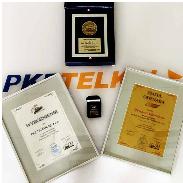
Wyróżnienie jakie otrzymała Spółka PKP TELKOL podczas jubileuszu 20 - lecia Polskiej Izby Producentów Urządzeń i Usług na Rzec Kolei.