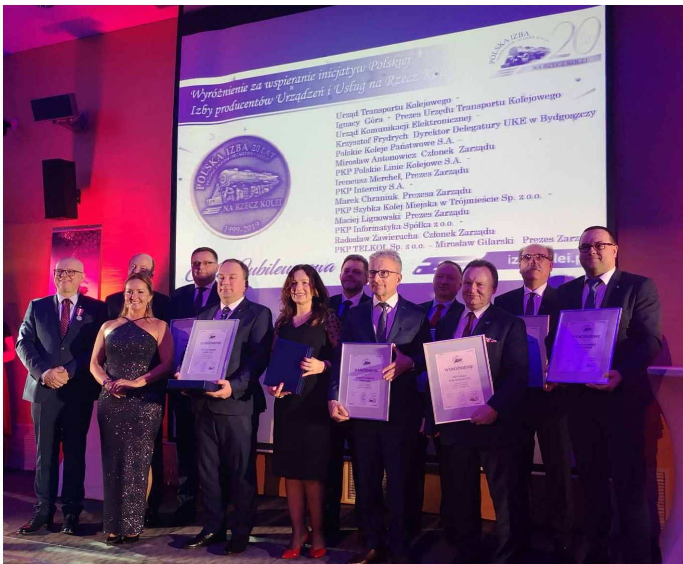
Przedstawiciele firm wyróżnionych za wspieranie inicjatyw Polskiej Izby Producentów Urządzeń i Usług na rzecz Kolei.