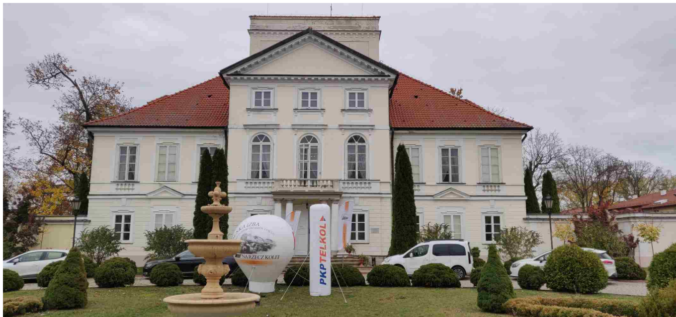
Pałac Ossolińskich w Sterdyniu.