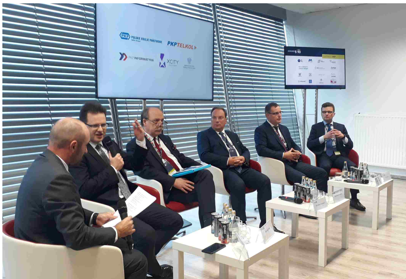
Uczestnicy panelu „potencjał Kolei - więcej niż pociągi i dworce”.