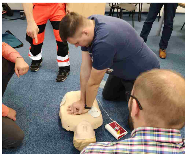
Uczestnicy szkolenia podczas ćwiczeń praktycznych.