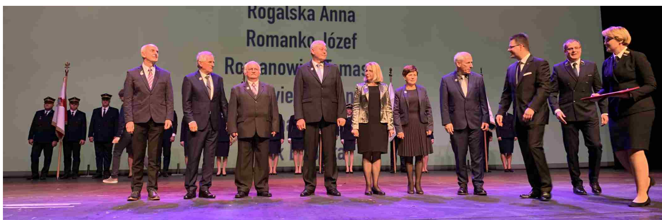
Odnaczeni pracownicy PKP TELKOL.

18 listopada 2019 roku w Teatrze Wielkim – Operze Narodowej w Warszawie odbyła się coroczna Gala z okazji Święta Kolejarza. Uroczystości te dają możliwość podziękowania wszystkim związanym z koleją osobom za pracę i nierzadko wieloletnie zaangażowanie w rozwój polskiego transportu kolejowego.