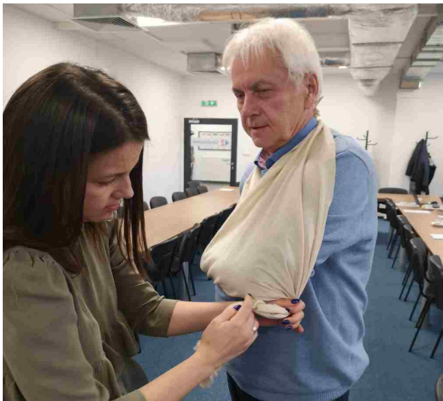
Uczestnicy szkolenia podczas ćwiczeń praktycznych.

W październiku i listopadzie odbyły się cykliczne szkolenia BHP dla kadry menedżerskiej organizowane przez Biuro Spraw Pracowniczych w naszej spółce zgodnie z Rozporządzeniem Ministra Gospodarki i Pracy z dn. 27 lipca 2004 roku, w sprawie szkolenia w dziedzinie bezpieczeństwa i higieny pracy. Szkolenie okresowe dla Pracodawców i osób kierujących pracownikami miało na celu aktualizację oraz uzupełnienie wiedzy i umiejętności szczególnie z zakresu oceny zagrożeń występujących w procesach pracy oraz ryzyka związanego z tymi zagrożeniami, kształtowania bezpiecznych i higienicznych warunków pracy oraz ochrony pracowników przed zagrożeniami związanymi z wykonywaną pracą.