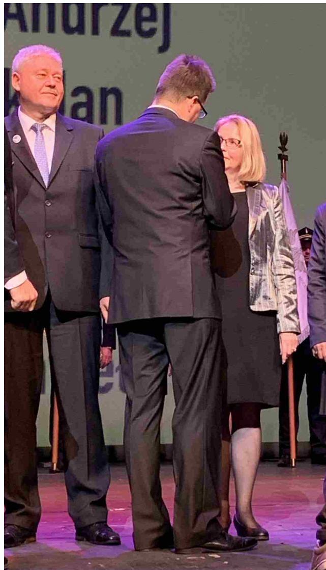
Minister Andrzej Bittel odznacza pracowników PKP TELKOL.