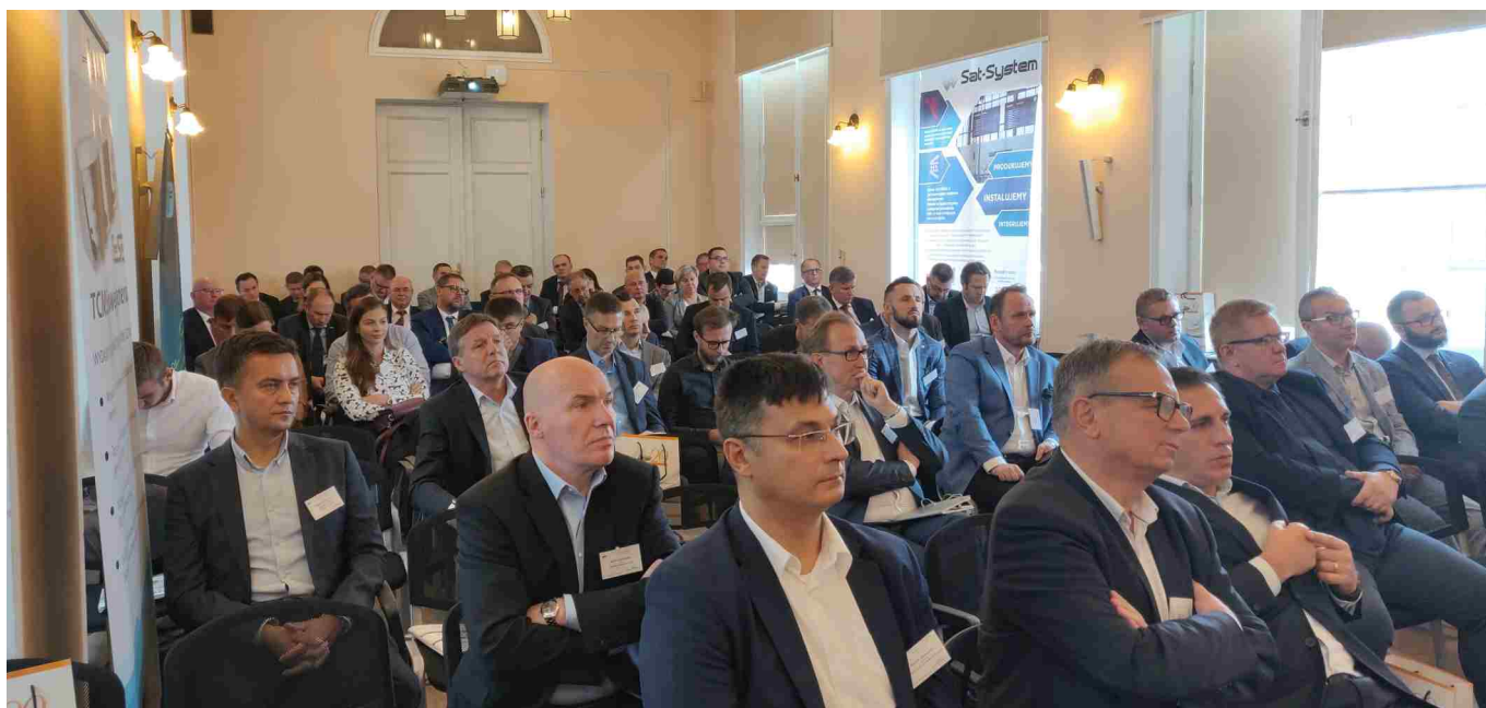
Uczestnicy konferencji.