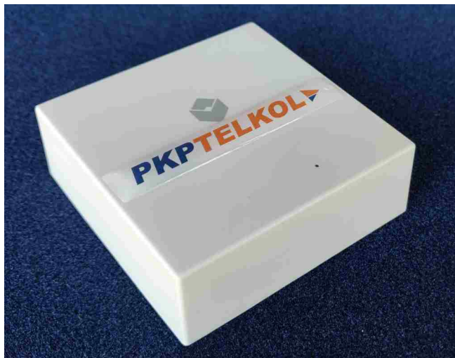
Beacon dostarczany przez PKP TELKOL.

Beacony są obecne w galeriach handlowych, muzeach i na lotniskach. PKP TELKOL wprowadza te małe nadajniki sygnału radiowego mogące komunikować się z naszymi smartfonami na dworcu, by ułatwić nam pozyskiwanie potrzebnych informacji czy skierować do sklepu.