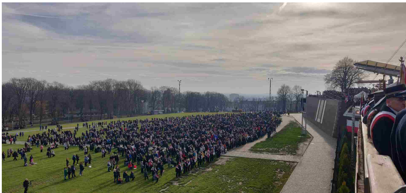
Uczestnicy pielgrzymki podczas Mszy Świętej.