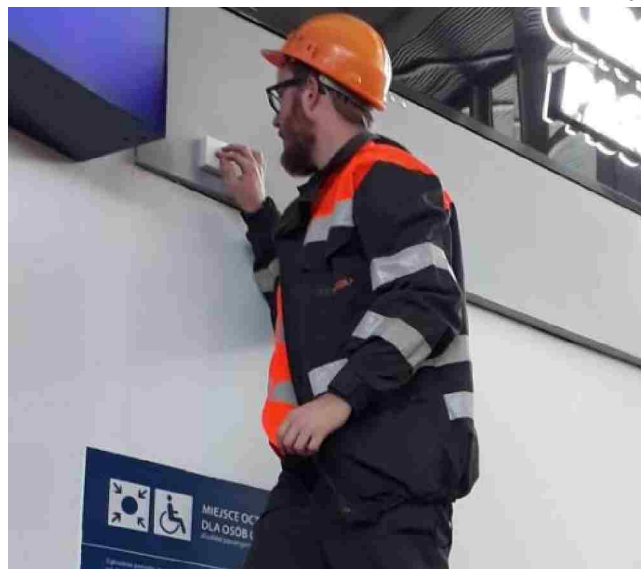
Montaż beacona w obiekcie dworcowym.