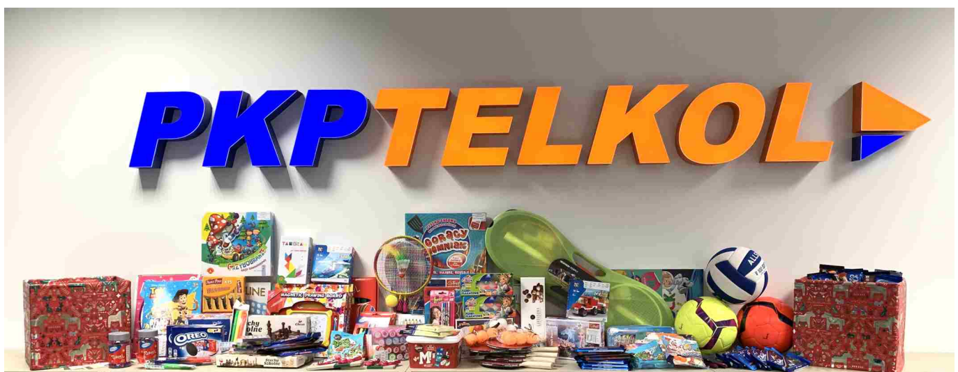
Prezenty dla dzieci zebrane przez pracowników PKP TELKOL.