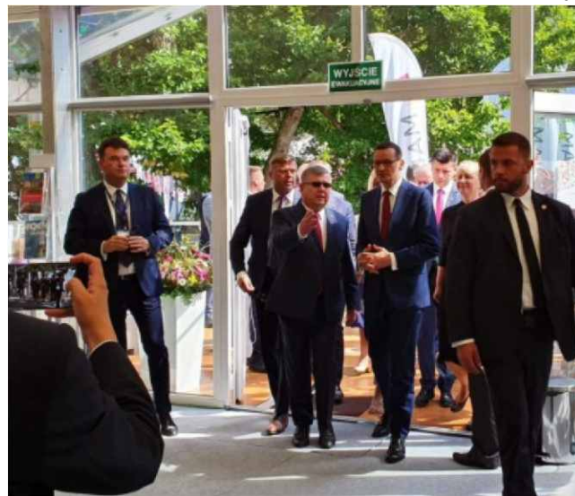
Prezes Rady Ministrów - Mateusz Morawiecki na FEK.