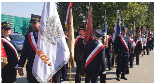
Cześć poległym oddają poczty sztandarowe.

Uroczystości rozpoczęły się pod Pomnikiem Celników Polskich w Malborku, gdzie przy salwie honorowej oddano cześć poległym bohaterom oraz złożono kwiaty pod pomnikiem.