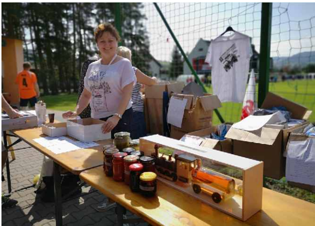
Loteria charytatywna na rzecz potrzebujących.