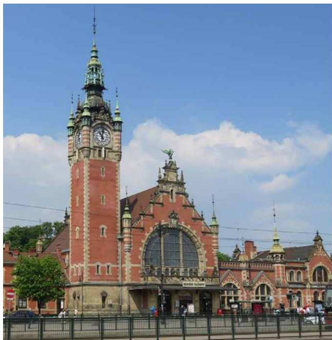
Dworzec Gdańsk Główny.

PKP S.A. podpisała umowę z wykonawcą na kompleksową przebudowę dworca kolejowego Gdańsk Główny. Dzięki tej inwestycji poprawiony zostanie stan techniczny i estetyczny budynku oraz usprawniony ruch podróżnych. Dzięki instalacji nowoczesnego systemu monitoringu, zwiększy się poziom bezpieczeństwa podróżnych. Cały kompleks dworcowy zostanie przebudowany, zarówno wewnątrz, jak i na zewnątrz: układ drogowy przy budynku dworca oraz budynek wraz z zagospodarowaniem otaczającego go terenu.