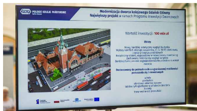
Informacja o zakresie planowanej modernizacji.