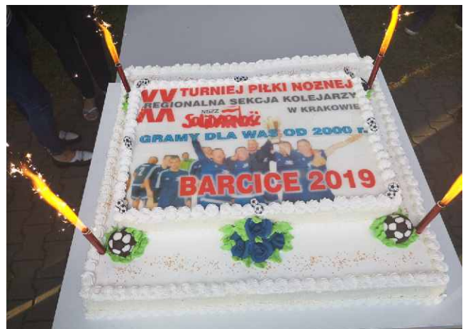
Tort jubileuszowy.