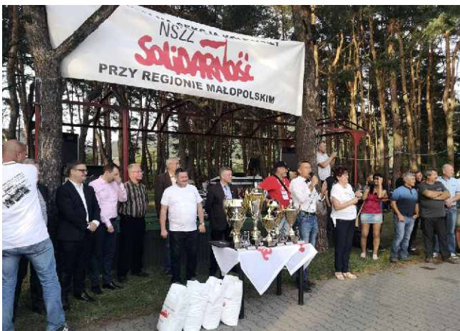
Rozdanie nagród.