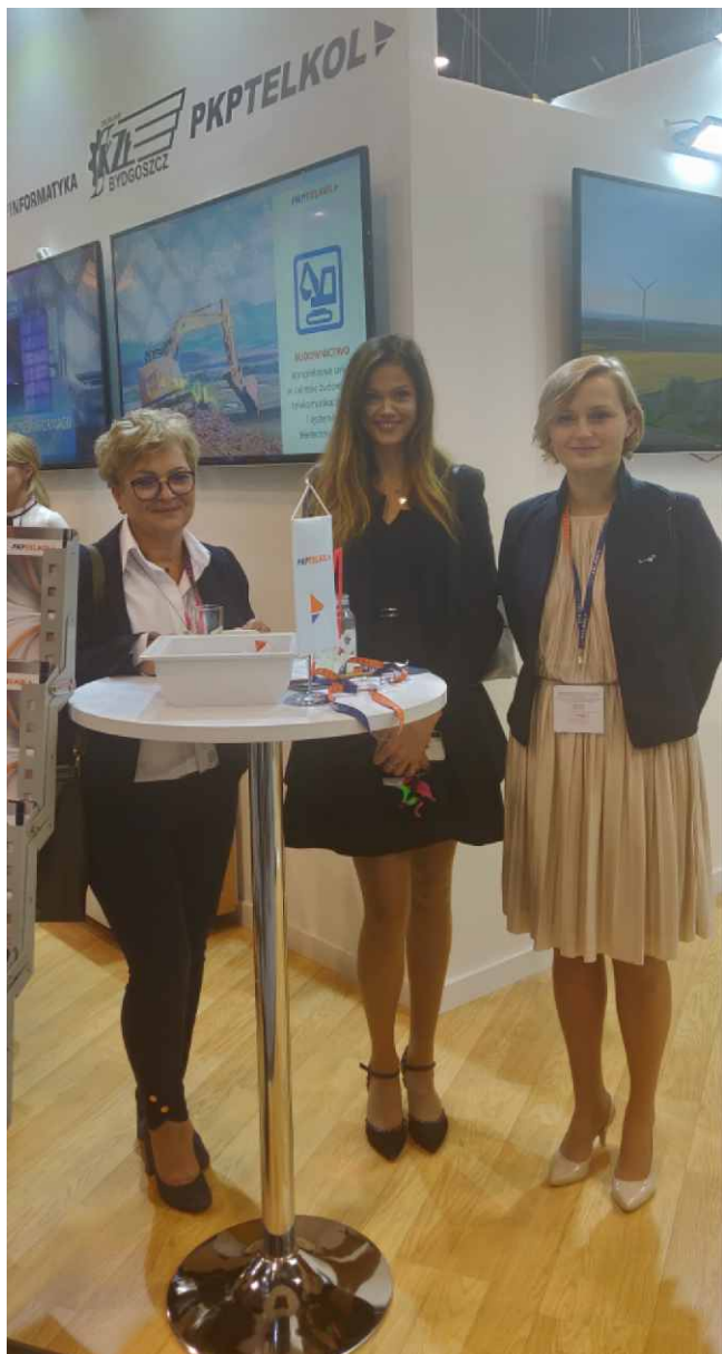
Pracownicy PKP TELKOL w strefie spółki na stoisku GRUPY PKP.