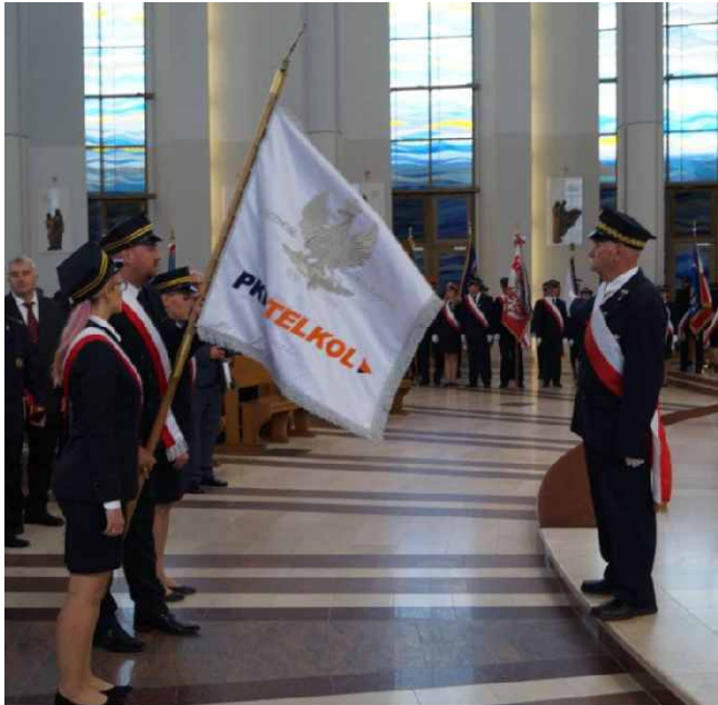
Poczet sztandarowy PKP TELKOL przed ołtarzem w Sanktuarium w Łagiewnikach.

Katolickie Stowarzyszenie Kolejarzy Polskich Koło w Krakowie, 14 września 2019 roku, po raz XVII zorganizowało Ogólnopolską Pielgrzymkę Kolejarzy. Uroczystość, zgodnie z tradycją, miała miejsce w Sanktuarium Bożego Miłosierdzia w krakowskich Łagiewnikach, a spółka PKP TELKOL miała okazję uczestniczyć w tym wydarzeniu po raz drugi.