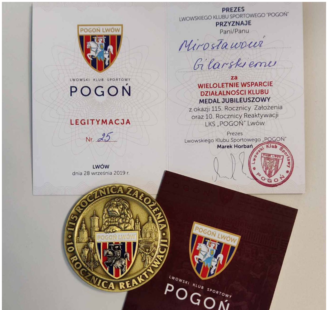
Medal okolicznościowy z okazji 115 rocznicy powstania oraz 10 rocznicy reaktywacji Lwowskiego Klubu Sportowego "Pogoń".