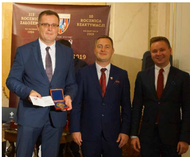
Prezes Zarządu PKP TELKOL w imieniu swoim i Fundacji Grupy PKP odebrał okolicznościowe medale.