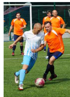
Nasi zawodnicy dawali z siebie wszystko.