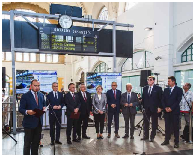
Briefing prasowy dotyczący modernizacji gdańskiego dworca.

Zbudowany zostanie również nowy odcinek tunelu podziemnego wydłużającego tunel PLK i tunel miejski. Wewnątrz budynku odtworzone zostaną dębowe witryny kasowe i sklepowe. Zainstalowane zostanie oświetlenie wzorowane na historycznym. Co więcej, historyczne witraże oraz kartusze z herbami pomorskich miast zrekonstruowane będą na podstawie zachowanych zdjęć. W budynku dworca i w jego otoczeniu zamontowany zostanie System Dynamicznej Informacji Pasażerskiej, za pośrednictwem którego podróżni znajdą informacje o rozkładzie jazdy pociągów.