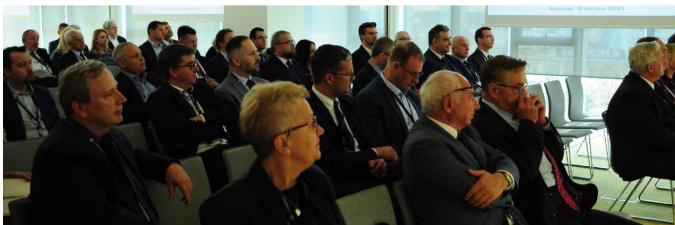
Uczestnicy IV Konferencji Naukowo - Technicznej "IT w Transporcie Szynowym".