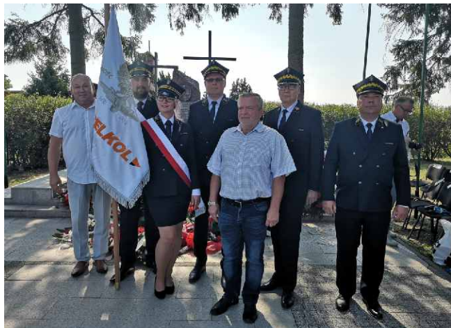
Pracownicy PKP TELKOL w Szymankowie.

PKP TELKOL na obchodach 80. rocznicy wybuchu II wojny światowej