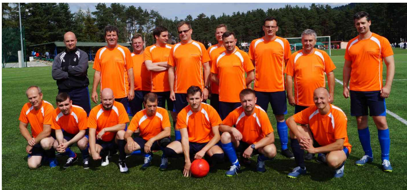
Drużyna PKP TELKOL w pełnym składzie.

W piątek, 6 września Regionalna Sekcja Kolejarzy NSZZ „Solidarność” w Krakowie zorganizowała w Barcicach koło Starego Sącza XX Turniej Piłki Nożnej z udziałem ponad 500 kolejarzy.