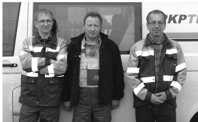
Zespół RUI 1.06 Koluszki

Ponadto PKP Utrzymanie oferowało usługi operatorские: dzierżawę łączy analogowych, kolokację, usuwanie kolizji z istniejącą telekomunikacyjną infrastrukturą kolejową oraz wykonywanie uzgodnień dokumentacji technicznej i wywiadów branżowych. Na wniosek właściciela – PKP S.A. nad nowopowstałą spółką funkcje właścicielskie objęła PKP PLK S.A., czyli właściciel infrastruktury kolejowej, co na starcie pomogło wypracować PKP Utrzymanie silną pozycję na rynku kolejowym.