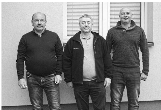
Zespół Utrzymania Telekomunikacji RUT 1.05

Podstawowym zadaniem Spółki było prowadzenie działalności związanej z utrzymaniem linii telekomunikacyjnych, urządzeń telekomunikacji przewodowej, radiokomunikacyjnych i specjalnych – głównie związanych z prowadzeniem ruchu pociągów oraz systemami dynamicznej informacji podróżnych.