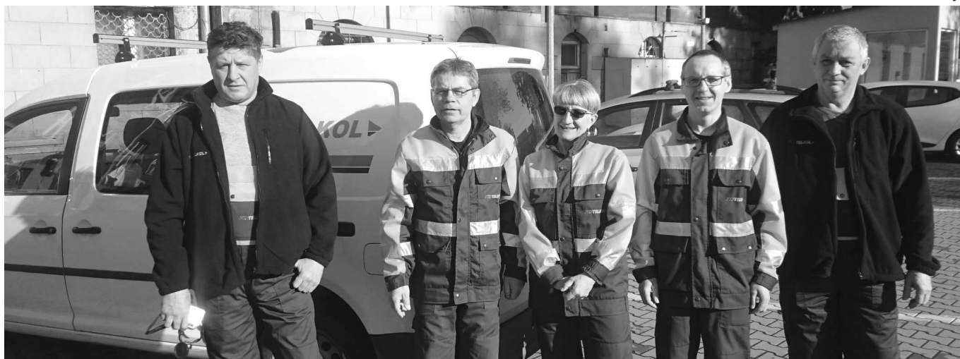
Zespół RUT3.04 Wrocław