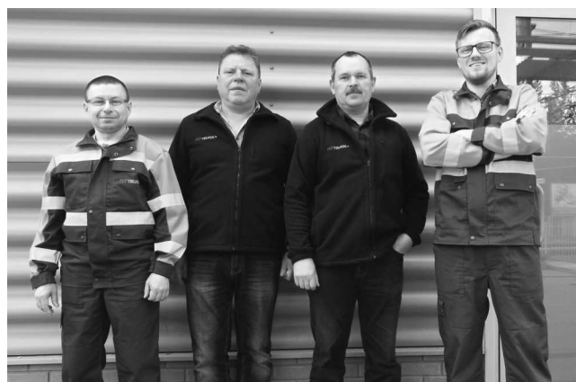
Grupa składająca się z pracowników RUT3.03 i RUI3.05 Zielona Góra

Ponadto PKP Utrzymanie oferowało usługi operatorские: dzierżawę łączy analogowych, kolokację, usuwanie kolizji z istniejącą telekomunikacyjną infrastrukturą kolejową oraz wykonywanie uzgodnień dokumentacji technicznej i wywiadów branżowych. Na wniosek właściciela – PKP S.A. nad nowopowstałą spółką funkcje właścicielskie objęła PKP PLK S.A., czyli właściciel infrastruktury kolejowej, co na starcie pomogło wypracować PKP Utrzymanie silną pozycję na rynku kolejowym.