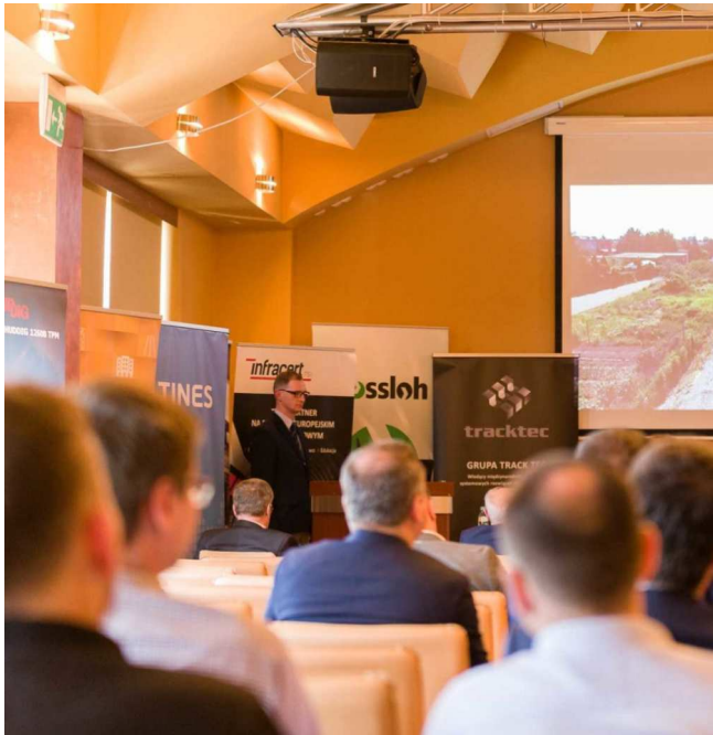
Konferencja INFRASZYN 2019

W dniach 24 – 26 kwietnia 2019 r. w Ośrodku Wypoczynkowym „HYRNY” w Zakopanem odbyła się XII Konferencja Naukowo-Techniczna organizowana przez Stowarzyszenie Inżynierów i Techników Komunikacji RP oddział w Radomiu - "Projektowanie, budowa i utrzymanie Infrastruktury w transporcie szynowym"