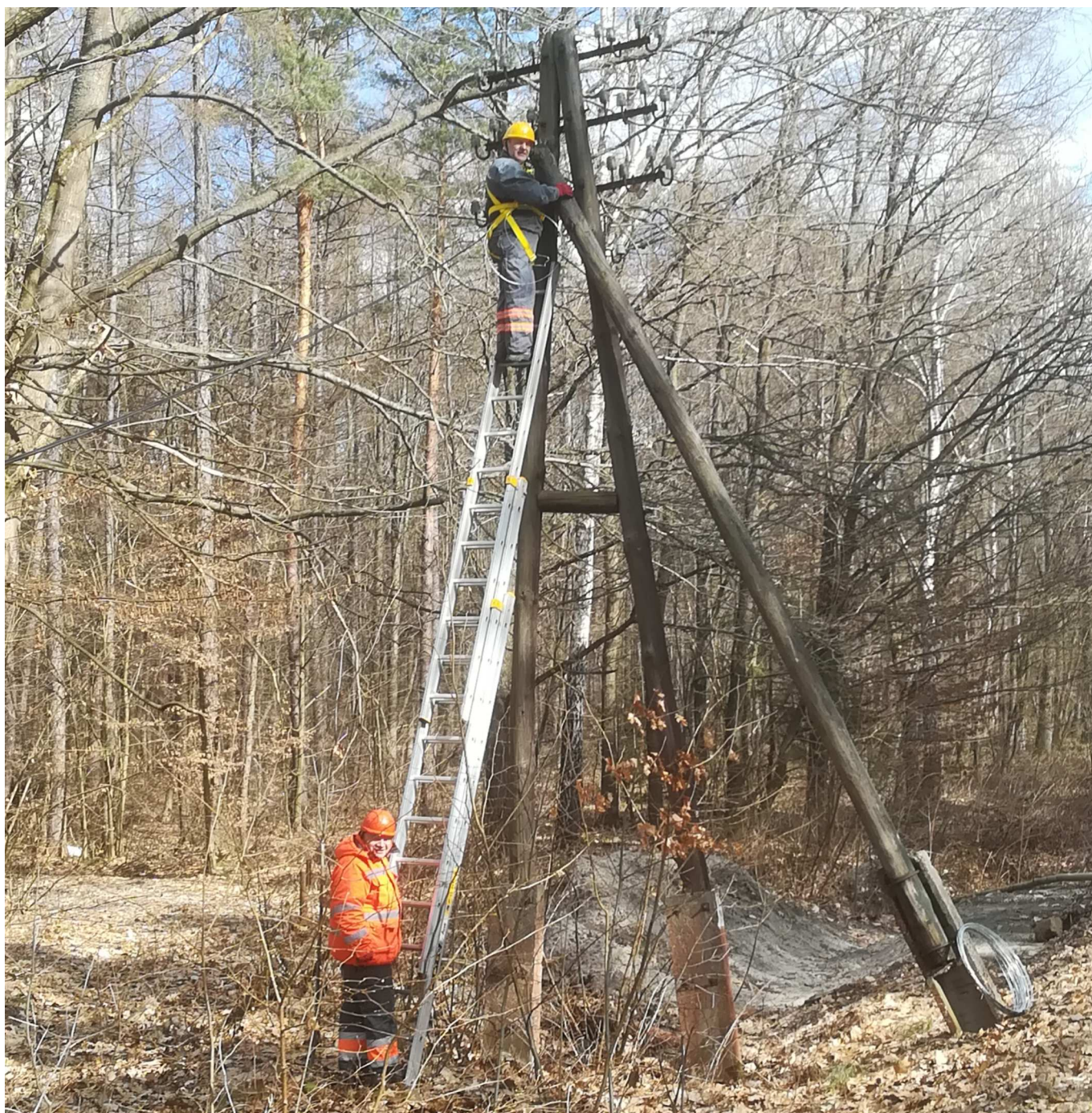
Usuwanie awarii na linii napowietrznej Hrebenne - Werchrata, linia 101. Pracownicy zespołu RUI1.22.