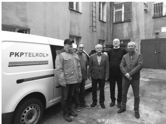
Grupa pracowników RUI3.03, RUT3.02 i RUR3.01

PKP Utrzymanie szybko zostało największym w Polsce dostawcą usług serwisu sprzętu telekomunikacyjnego dedykowanego firmom działającym w sektorze kolejowym.