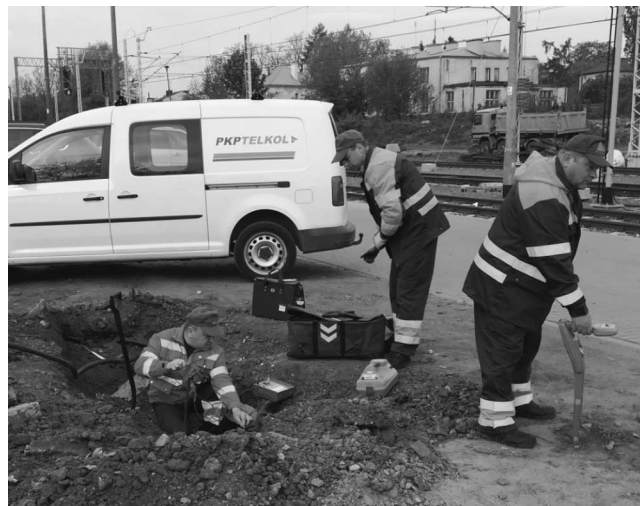
Zespół RUI 1.11 Małkinia

Spółka PKP TELKOL aktywnie włączyła się w program elektromobilności, realizując wspólnie z PKP S.A. i KZŁ Bydgoszcz budowę stacji ładowania samochodów