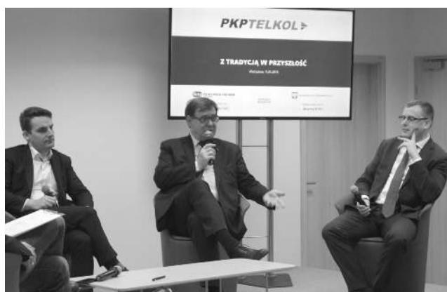
Konferencja „Z tradycją w przyszłość”

W tym roku dołączyliśmy do programu Klaster Luxtorpeda 2.0 , którego celem jest tworzenie rozwiązań przyspieszających modernizację i konkurencyjność polskich kolei.