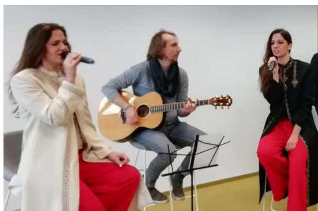
Kolędy w wykonaniu Sióstr Goławskich wprowadziły wszystkich w świąteczny nastrój

Nie zabrakło artystycznego, muzycznego akcentu naszej Wigilii. Zaproszenie przyjęły siostry Goławskie, które wystąpiły przy akompaniamencie gitary. Siostry Goławskie to utalentowane muzycznie bliźniaczki, które zdobyły serca jurorów w 3. edycji popularnego talent show – "X-factor". Ich muzyka wprowadziła wszystkich