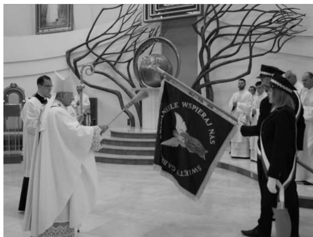
Poświęcenie sztandaru PKP TELKOL podczas XVI Ogólnopolskiej Pielgrzymki Kolejarzy

8 września, podczas XVI Ogólnopolskiej Pielgrzymki Kolejarzy, uroczyście przyjęliśmy swój własny sztandar , który został poświęcony podczas uroczystej mszy świętej przez biskupa Marka Jędraszewskiego, Metropolity Krakowskiego. Jesteśmy dumni, że PKP TELKOL posiada własny sztandar, który identyfikuje naszą tożsamość.