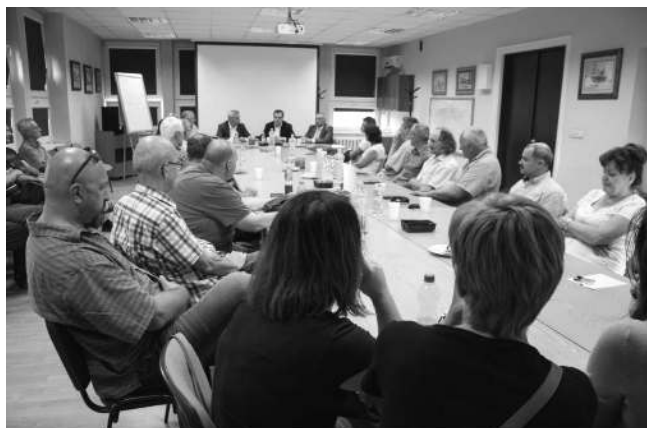
Spotkanie Zarządu z pracownikami w Regionie Południowym

pracownicze. Wyjazdy do Regionów były świetną okazją do tego, aby porozmawiać z pracownikami, wysłuchać co mają do powiedzenia i odpowiedzieć na nurtujące ich pytania.