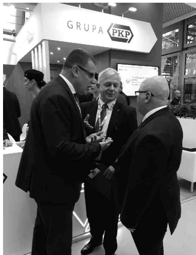
Rozmowy przy stoisku Grupy PKP.