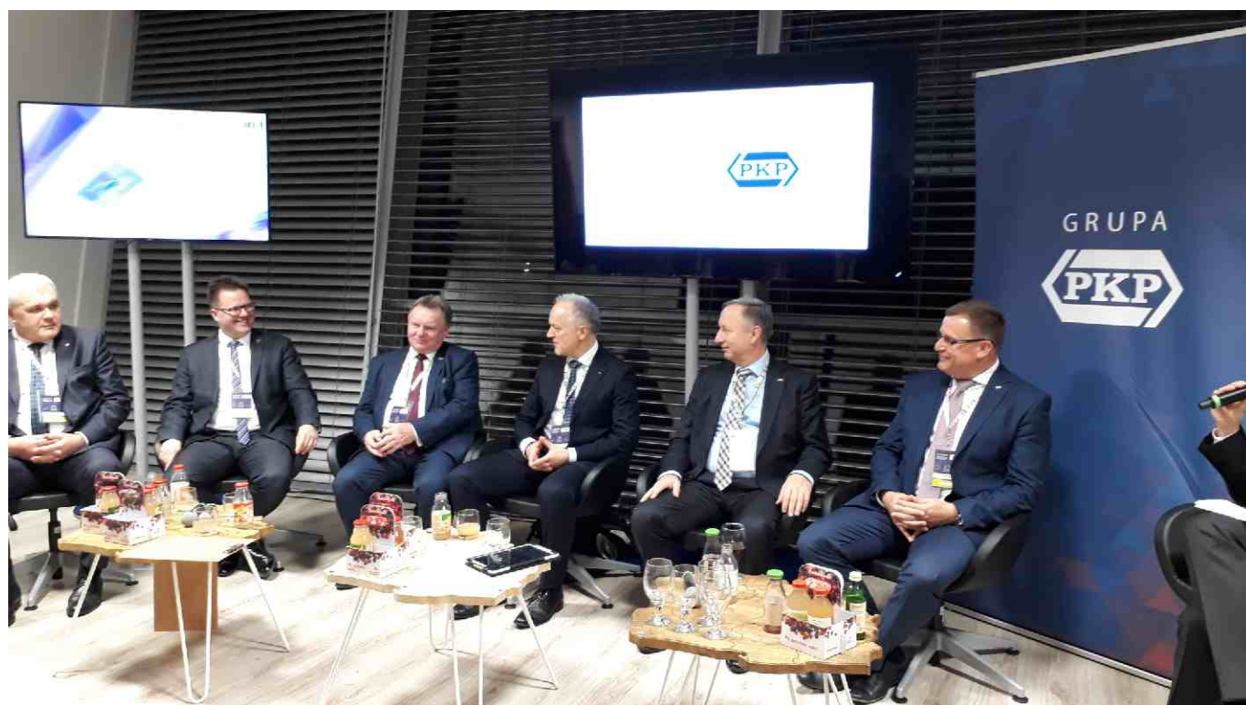
Uczestnicy panelu Po pierwsze pasażer! podczas Kongresu 590.