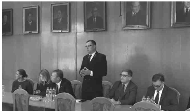
Posiedzenie Rady Gospodarczej.

20 listopada w siedzibie PKP PLK S.A w Krakowie przy Placu Matejki odbyło się kolejne spotkanie Rady Gospodarczej Wojewody Małopolskiego Piotra Ćwika.