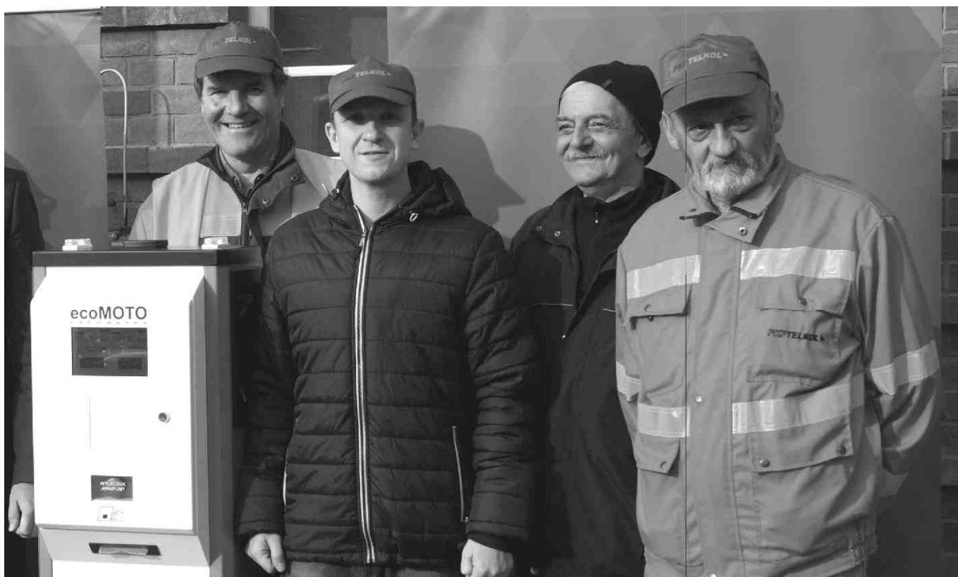
Pracownicy Rejonu Południowego przy stacji ładowania samochodów elektrycznych.