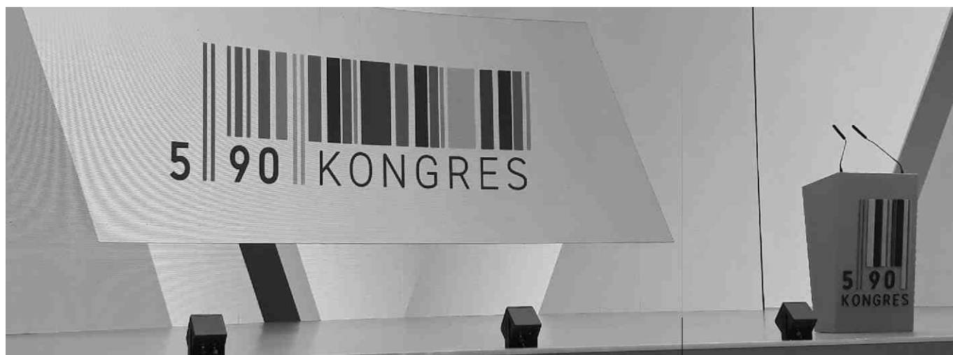
Logo Kongresu 590.

Była to już trzecia edycja Kongresu 590. Po raz kolejny w Jasionce koło Rzeszowa odbyło się jedno z najważniejszych wydarzeń ekonomicznych w Polsce, podczas którego zostały wyznaczone kierunki rozwoju polskiego biznesu.