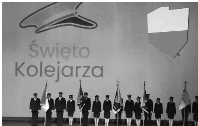
Poczty sztandarowe spółek Grupy PKP.

Święto Kolejarza to ważny dzień w życiu pracowników Kolei oraz osób z nią związanych. To okazja do tego, aby podziękować wszystkim tym, którzy każdego dnia przyczyniają się do rozwoju kolejnictwa w Polsce.