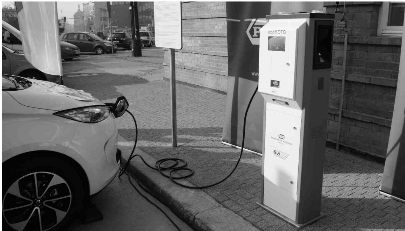
Pierwsza otwarta stacja ładowania samochodów elektrycznych w Gliwicach.

Choć jeszcze niedawno elektromobilność wydawała się odległą przyszłością to szybko stała się wyzwaniem bieżącym. Program rozwoju elektromobilności jest jednym z filarów Rządowego Planu na rzecz Odpowiedzialnego Rozwoju. Warunki do upowszechnienia transportu elektrycznego w Polsce, a tym samym otwarcie nowych perspektyw rozwoju, zapewnia Ustawa o elektromobilności uchwalona przez Sejm 11 stycznia 2018 roku.