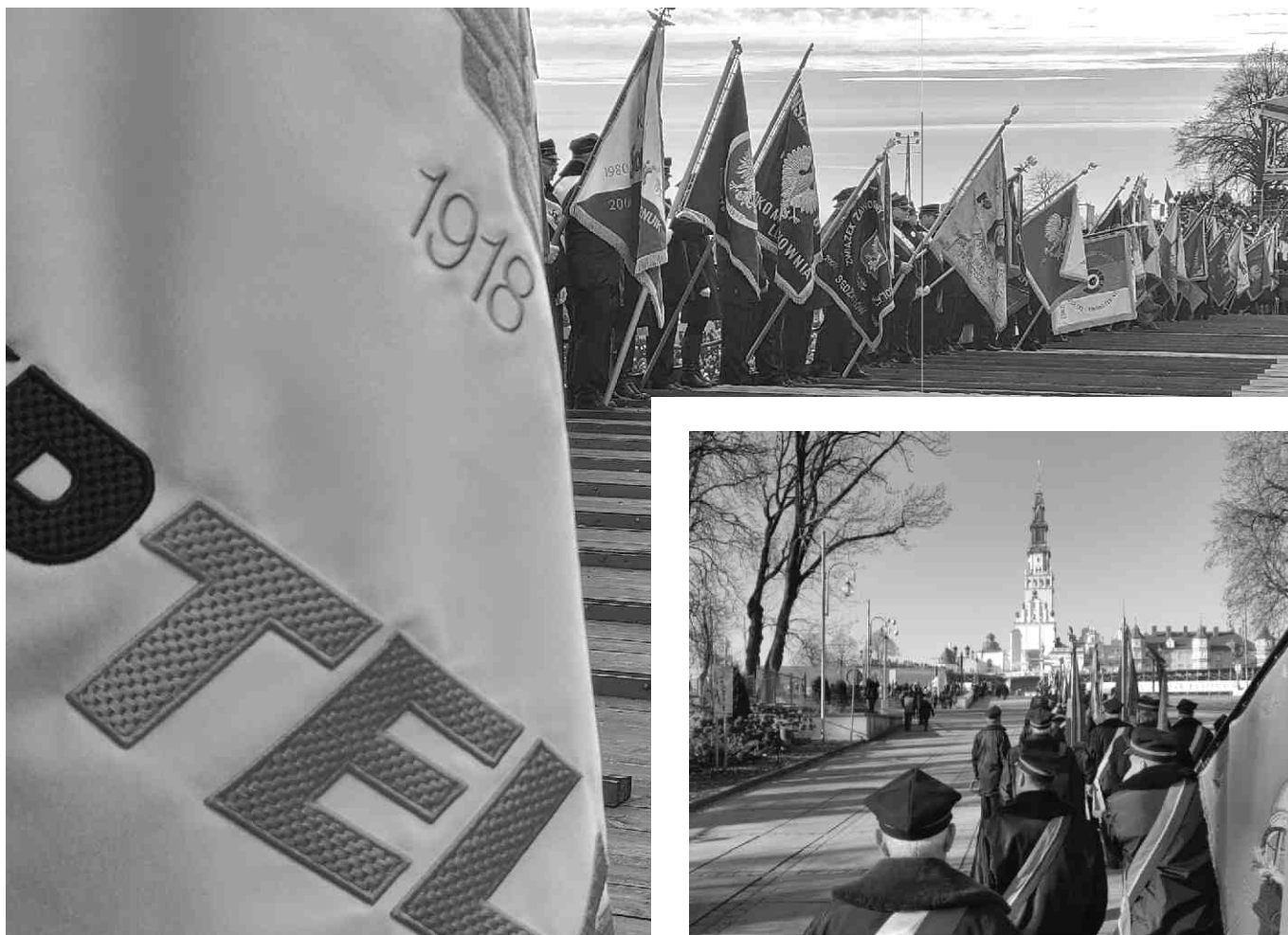
Przejście pocztów sztandarowych na Jasną Górę.