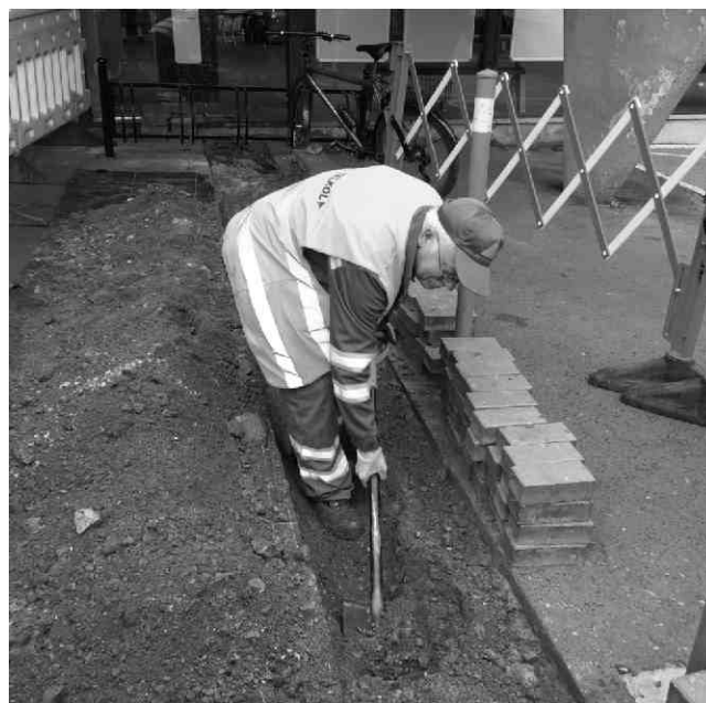
Prace wykonawcze prowadzone przez pracowników Regionu Południowego.

czenia, zakończone fundamentem do posadowienia stacji ładowania. Miejsca parkingowe przy stacjach ładowania zostały odnowione, pomalowane i stosowanie oznakowane. Montażu i uruchomienia stacji ładowania dokonał KZŁ Bydgoszcz.