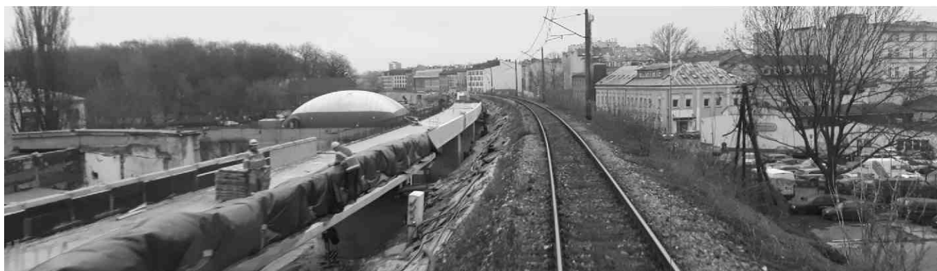
Przejazd dreżyną po modernizowanej trasie do stacji Krakow-Główny.