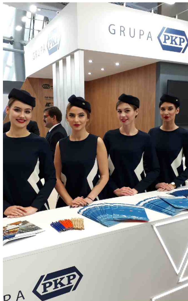
Stoisko Grupy PKP podczas Kongresu 590.