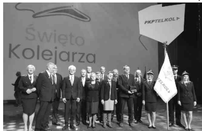
Pamiątkowe zdjęcie odznaczonych z Prezesem Zarządu i Przewodniczącą Rady Nadzorczej.