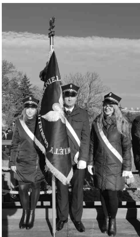
Poczet sztandarowy PKP TELKOL.